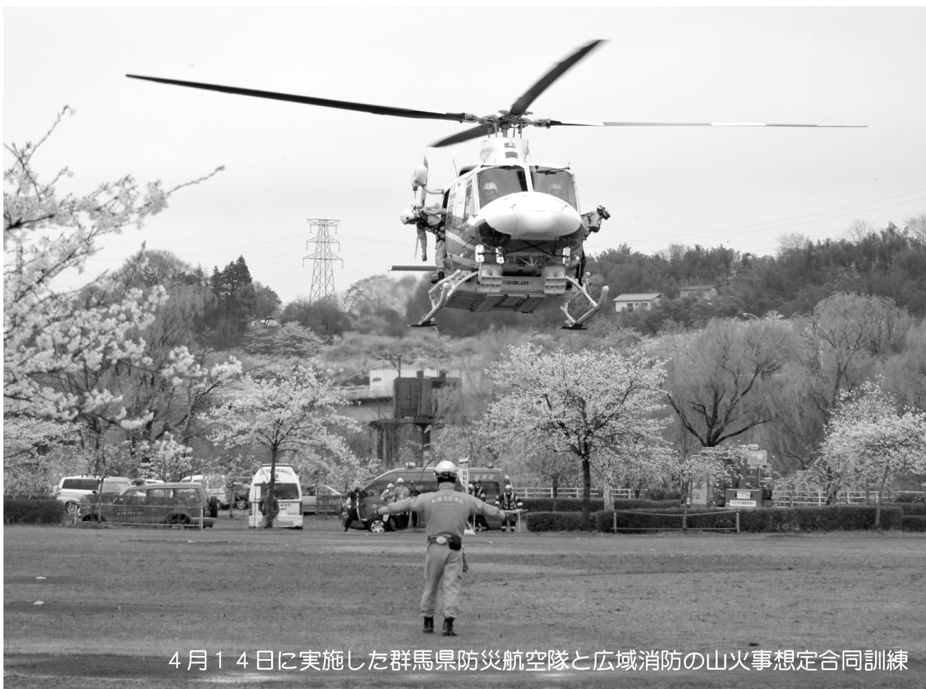
4月14日に実施した群馬県防災航空隊と広域消防の山火事想定合同訓練

発行者 利根沼田広域市町村圏振興整備組合 / 住所 〒378-0051沼田市上原町1,801番地2 ☎0278(22)3691