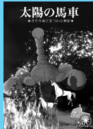
【6月】 さそり座にまつわる物語