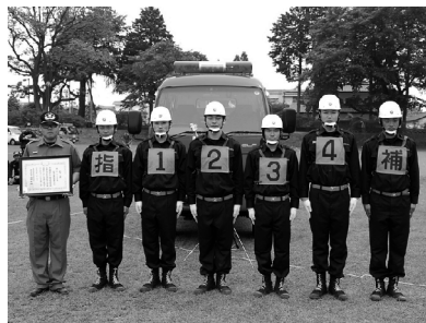
■自動車ポンプの部で優勝した昭和村第7分団