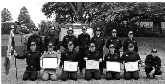
■小型ポンプの部で優勝した昭和村第10分団