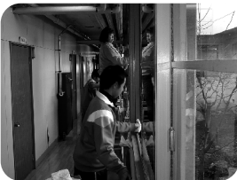
■サークル竹の子による 清掃奉仕の様子