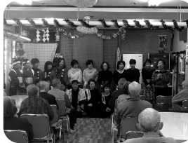
■沼田市婦人会による交 流会の様子