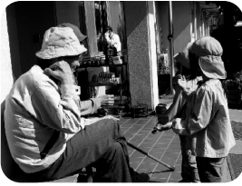
■桜ヶ丘保育園による交 流訪問の様子

愛宕・猿ヶ京両老人ホームでは、様々なボランティア団体の方々に支えられて円滑な運営が行われています。