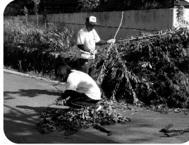
■ジフルタ生命沼田支部 による草刈り奉仕の様子