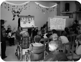
■沼田朗誦奉仕会による クリスマス訪問の様子