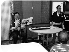
■三峰会による交流会の 様子