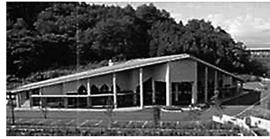
沼田市上沼須町のぬまた聖苑全景

〒378-0051 群馬県沼田市上原町1801-2 利根沼田文化会館内 利根沼田広域市町村圏振興整備組合 事務局企画係 TEL 0278-22-3691 FAX 0278-23-8339 広域圏ホームページ http://www.oze.or.jp/